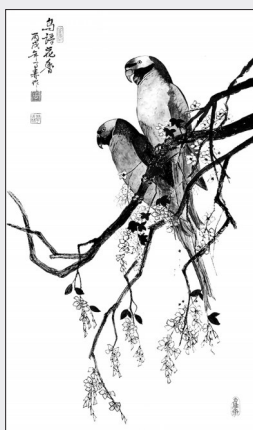
▲国画·鸟语花香 湖北宜昌 周学森 73岁