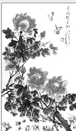
▲国画·春到蝶先知 黑龙江讷河 闫智慧 85岁