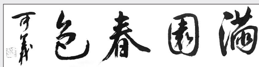
▲书法·满园春色 安徽合肥 夏可义 65岁